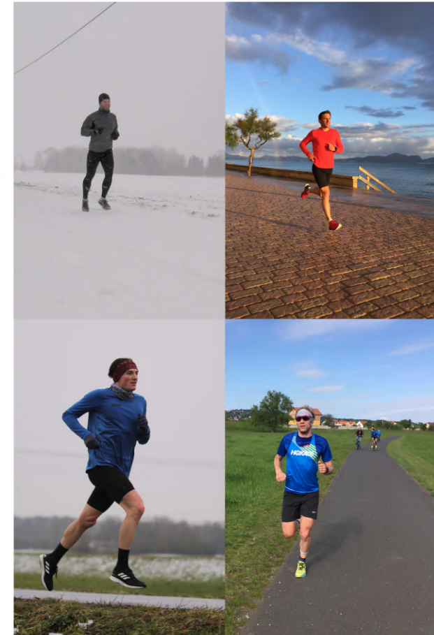
Training zu jeder Jahreszeit