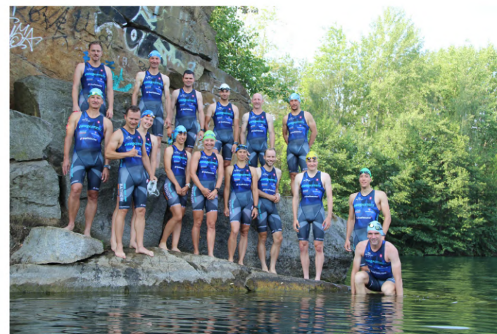
Swim&Run an der Luise